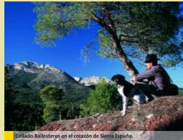
Collado Ballesteros en el corazón de Sierra Espuña.

sigue remontando cómodamente los zig zag de la vertiente Noroeste del Pico de Moriana. Arriba a la izquierda, se ven las ruinas de la Casa de Fuente Alta.