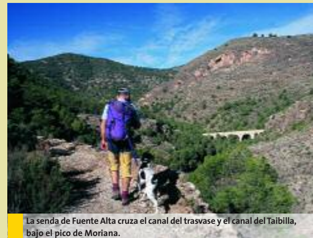
La senda de Fuente Alta cruza el canal del trasvase y el canal del Taibilla, bajo el pico de Moriana.

Cuando cruzamos en la umbría del pinar, la canaleta que baja de Fuente Alta (km 7,82 / Alt. 430 m) la senda gira a la derecha y