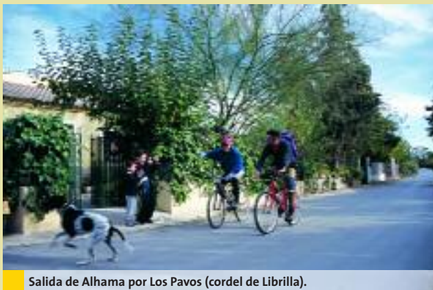
Salida de Alhama por Los Pavos (cordel de Librilla).